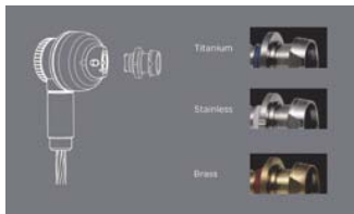
「カメラのレンズ交換のようなイメージで楽しんでほしい(美和氏)」というノズル交換パーツは、「チタン/ステンレス/真鍮」の3種類。「原音探究」を標榜するJVCらしく、内部の音響フィルターでF特に違いをつけるようなことはせず、あくまで金属素材の違いだけで微細な差を楽しむための設計となっている。