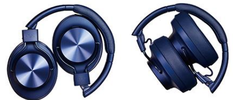
＜スイーベル&折りたたみ機構＞

音質にも配慮したソフトなレザー素材を使ったイヤーパッドを採用。耳を心地よく包み込む快適な装着感を実現しました。