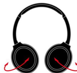
<フラット折りたたみ機構>

有線接続にも対応し、電波の使用が制限されている航空機内や充電切れの場合などは、有線ヘッドホンとしても使用できます。