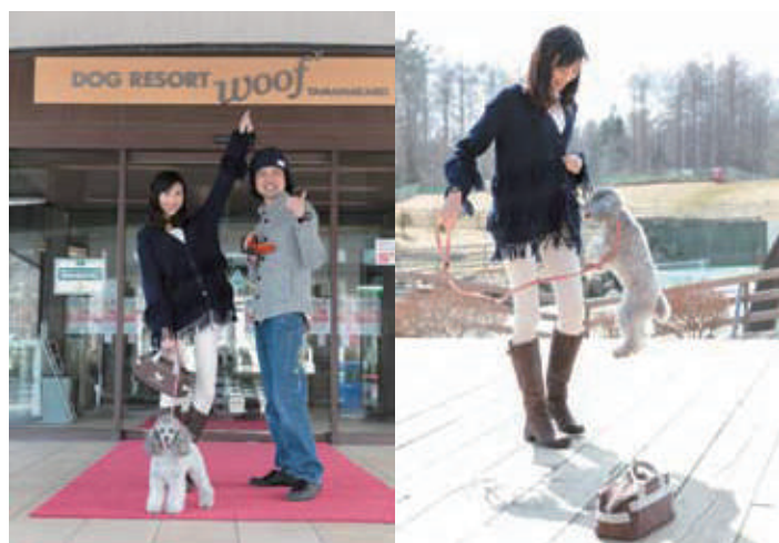
●到着後、受け付けを済ませて施設へ入場。ここはイヌのための設備が充実していて宿泊もできる。広大なドッグランを目の前に彼女もビートも元気いっぱいだ