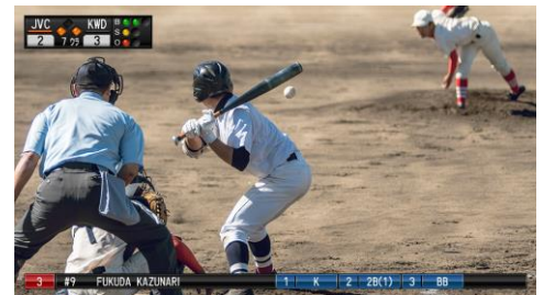
<スコア表示映像イメージ>

http://www3.jvckenwood.com/dvmain/support/tn/