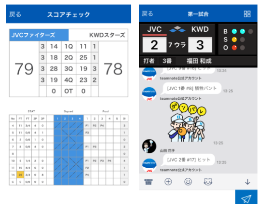
<スタッツ画面イメージ (バスケットボール) >