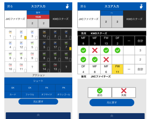
<スコア入力画面イメージ>