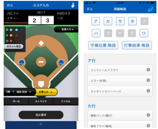
<スコア入力画面イメージ>