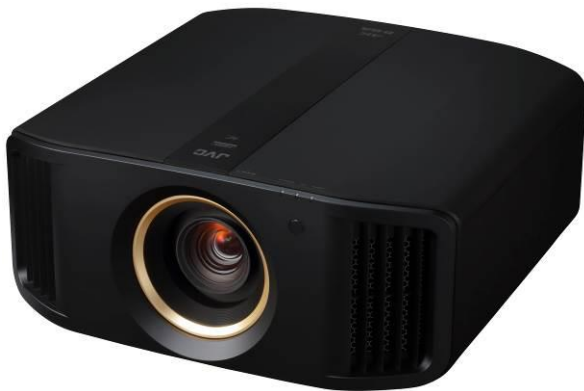
<DLA-V7/V5 (ブラック) >