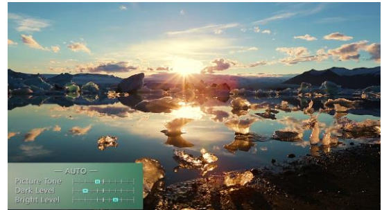
<「オートトーンマッピング」機能イメージ>

HDR10コンテンツの明るさ情報を示すマスタリング情報（MaxCLL/FALL ※6 ）に基づき、自動的 ※5 に画質調整を行う「オートトーンマッピング」機能を新たに搭載。コンテンツごとに明るさの異なるHDR映像が最適に視聴できるよう、画質を自動的 ※5 に調整します。