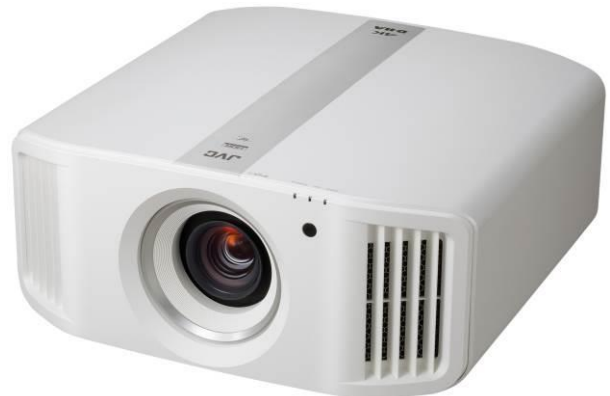
<DLA-V5 (ホワイト) >