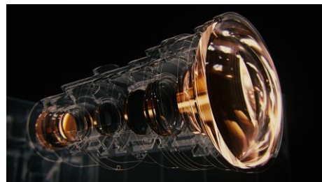
<オールガラス・オールアルミ鏡筒レンズイメージ>

16群18枚オールガラス・オールアルミ鏡筒レンズを搭載。また、上下 100%、左右43%という広いシフト範囲を確保しながら画面の隅々まで高解像度を映しきるために、100mmの大口径で、R/G/Bの屈折率の違いを加味した5枚の特殊低分散レンズを採用することにより、シフト時の色収差・じみなどを抑え、8K解像度を忠実に再現することが可能です。