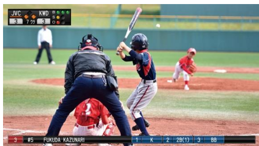
<スコア表示映像（野球）イメージ>