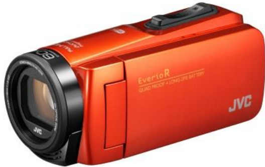
「GZ-RX685J-D (ブラッドオレンジ)」