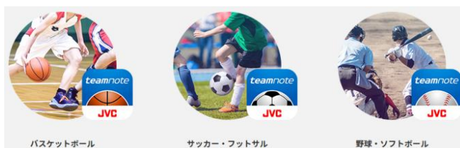
<スコア入力アプリ「teamnote SPORTS」シリーズ>