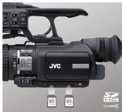
▲SDHCカード2枚に連続記録

報道の編集は本社で一元化して行われるので、道内に14ある拠点の仕事はENGの素材を送るまで。そういった意味では、GY-HM100が記録メディアとしてどこでも手軽に入手できるSDHCカードを採用している点も大きなポイントでした。本社へ素材を送ってしまえば、拠点は素材を保存しておく必要がなく、データを消去して再利用できるのでコスト面はもちろん、エコロジータン的にも優れた印象。また、テープやディスク方式のようなメカ部分が無いので、拠点のカメラマンはプロカメラの難しい操作や面倒なメンテナンスの必要が無いことも大きなアドバンテージです。