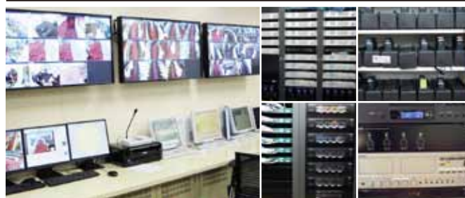
施設全体をネットワークするセキュリティ&コミュニケーションシステムを運用・管理。