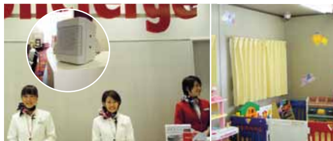
インターカム+パワースピーカーで万全のコンシェルジュサービス。キッズ室にはドームカメラ。