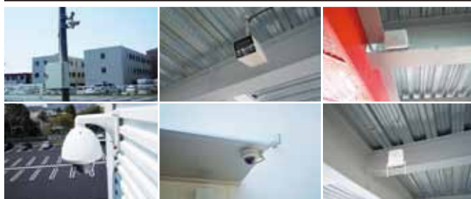
車両の出入・駐車状況を各所に配置したカメラで一括確認。ワイヤレス放送設備でお客様を円滑に誘導。