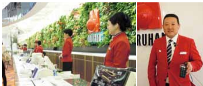
スタッフ間の情報共有はワイヤレスインターカムで。グループ分け、エリア分けも自由自在。