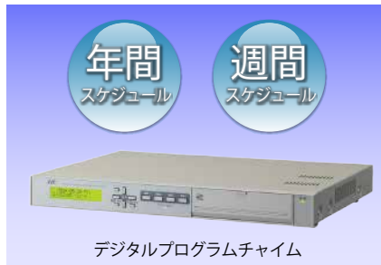
デジタルプログラムチャイム

緊急優先放送機能を搭載 防災・防犯システムと連携した緊急時のアナウンスを実行できます。非常時のメッセージは、日本語と英語の2ヶ国語を標準装備し、最大4ヶ国語まで対応可能です。無線機との連携により離れた所からでも拡声放送が可能になります。通常は、放送設備として報時放送や先生・生徒の呼び出しに使用できます。