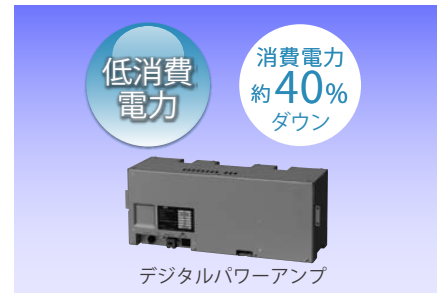
デジタルパワーアンプ

デジタルプログラムチャイム「PA-DT600(B)」接続可能 タイマー機能付PA-DT600(B)とのシステム化で定刻チャイムやアナウンス送出ができます。週間/年間のスケジュール管理に対応しています。