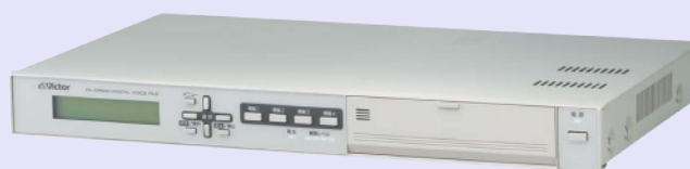
デジタルボイスファイル PA-DR600